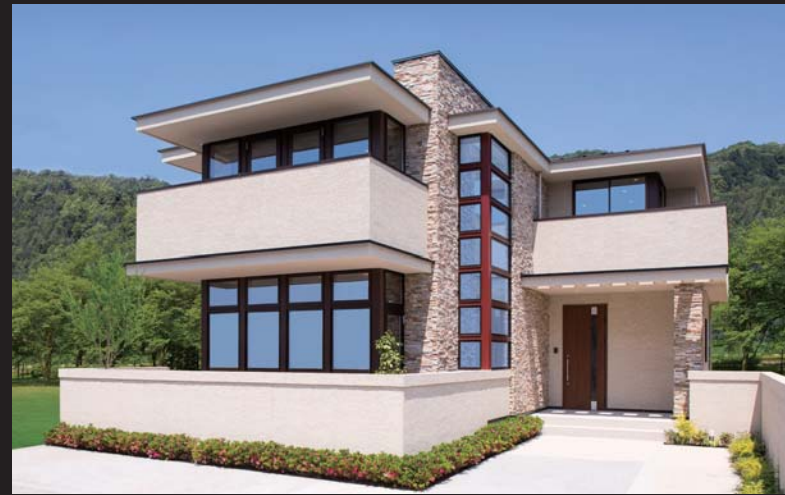
5-7-19 3LDK+ウォークインクローゼット ■敷地面積 / 172.27㎡ (52.11坪) ■延床面積 / 133.85㎡ (40.48坪)

ゆとりあふれる空間演出、素材感のあるインテリアデザイン。 すべてに上質を感じさせる一邸。