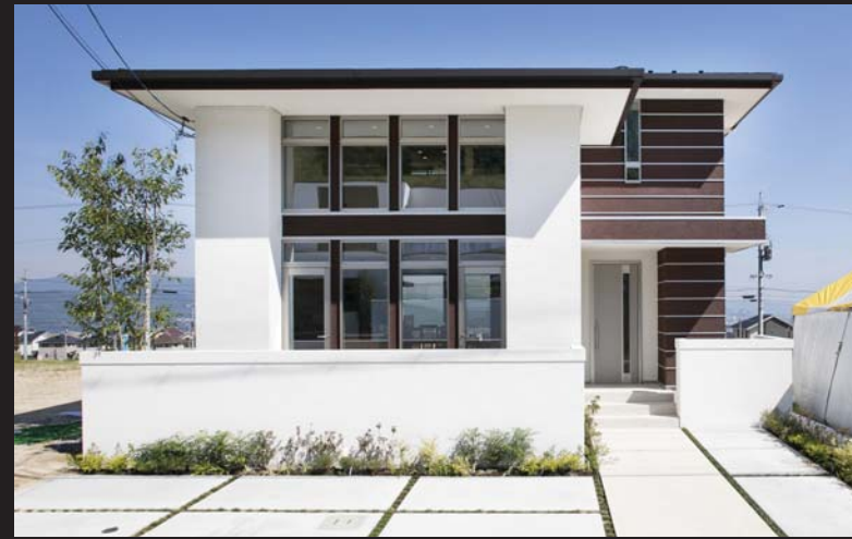
4-24-5 3LDK+ウォークインクローゼット+納戸 ■敷地面積 / 165.34㎡ (50.01坪) ■延床面積 / 102.68㎡ (31.06坪)

オープンスペース設計のLDKは、南北方向に開かれ、 開放感いっぱい。1・2階に納戸を設け、収納も充実。